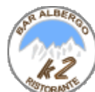
Bar Albergo K2 Madesimo